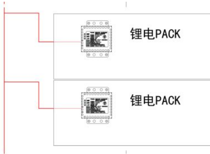
图 3 接线示意图